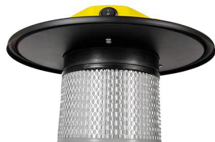
HEPA- Partikelfilter, auswaschbar und leicht auszutauschen