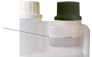
Abbildung Dosierbehälter mit Filzschreiber Strich bei 20 ml